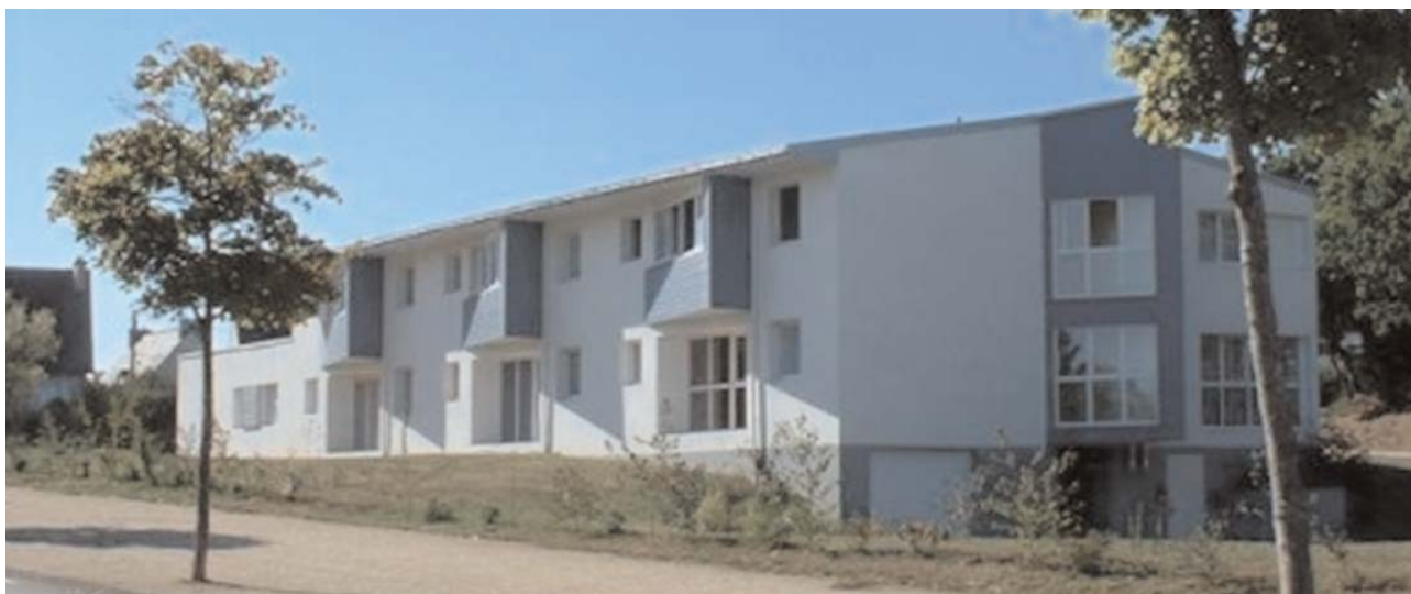
Etablissement ESAT Landivisiau - résidence de Coatmeur

Le CAT des Genêts d'Or s'est implanté à Landivisiau en 1977. En 2007, l'établissement accueille 111 usagers en situation de handicap : 46 sont ouvriers de l'ESAT, 3 sont retraités de l'ESAT et 62 vivent dans l'un des deux foyers de vie. 90 personnes salariées des Genêts d'Or assurent le fonctionnement de l'établissement.