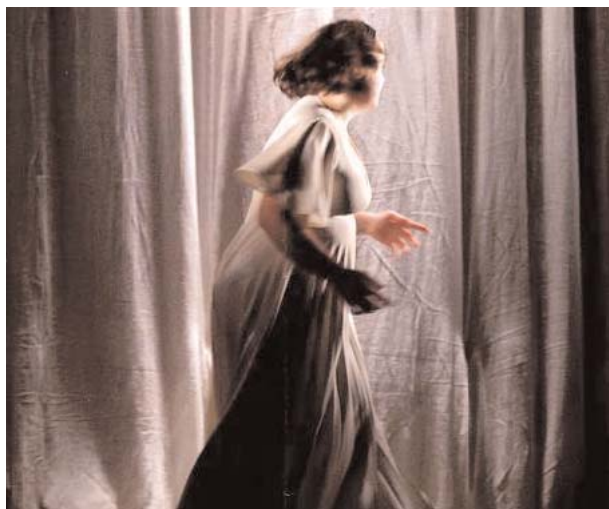
Catalyse sur scène.

De nombreux professionnels du secteur médico-social et des personnalités (philosophes, représentant du Comité national d'éthique...) ont répondu à l'invitation pour parler de la vie affective, de la bienveillance au travail ou des exemples à suivre venant d'autres pays européens.