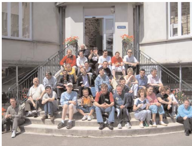
Assemblée des Représentants des Usagers.

Tous les membres de l'Assemblée ont profité de cette rencontre pour aborder le thème de la bienveillance. « Pour nous, la bienveillance, c'est tout à la fois avoir son chez-soi, bénéficier de sa tranquillité, être bien soigné, bien manger, et cela, même si nous suivons un régime... explique l'un des représentants. C'est aussi pouvoir s'exprimer et être écouté par un personnel respectueux de nos choix... Pouvoir faire ce que nous voulons, dans la limite de nos handicaps et problèmes de santé et parfois de nos finances. Bref, c'est nous permettre d'être indépendants dès lors que nous en sommes capables ». Autant dire que cet échange nourrira le colloque des Genêts d'Or, en décembre prochain, ayant pour thème la bienveillance.